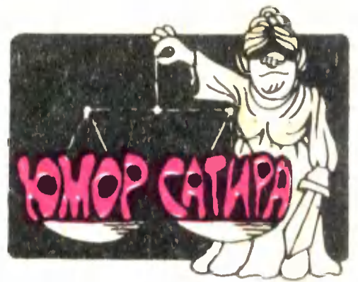
Рис. В. ТАМАЕВА.