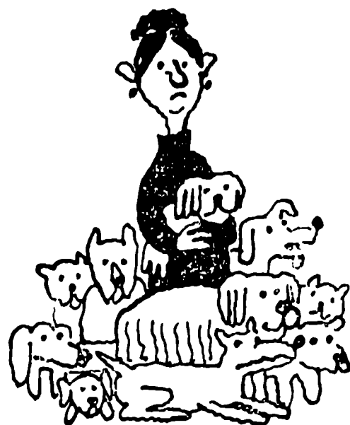
Рис. О. ТЕСЛЕРА.

В Эрлангене (ФРГ) одна женщина содержит в квартире 55 собак. В ответ на жалобы соседей отцы города заявили, что эта дама может держать в квартире не более трех животных. Но ни угрозы, ни просьбы не могли заставить строптивицу расстаться хотя бы с одним четвероногим другом. И теперь власти не знают, как решить щекотливый вопрос: ведь любительница собачек исправно платит за них налог, а это главное.